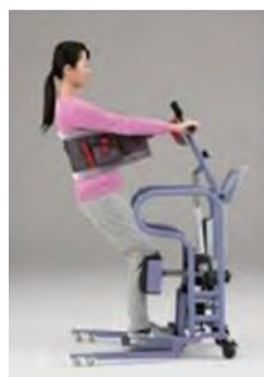
起立立位補助リフト