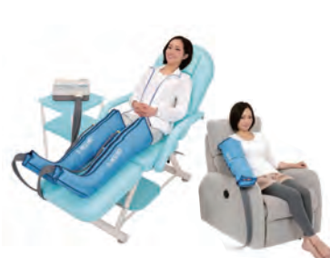
エアマッサージ器