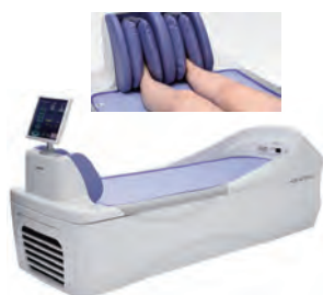
ウォーターベッド

最新のウォーターベッドやホットパック等の機器に加え、各種フィットネスマシンからトレーニングマシンを完備、車いすや歩行器もタイプ別に取り揃えております。その方の障害や生活に合わせた、マット上での個別リハビリに加えて、歩行器やレール走行式歩行訓練設備（最新式ジャケット吊り具）で、安心かつ積極的な歩行練習が可能です。福祉用具の選定や下肢装具のメンテナンスなど、専門の理学療法士が提供します。