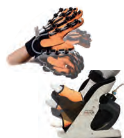
リハビリサポート機器